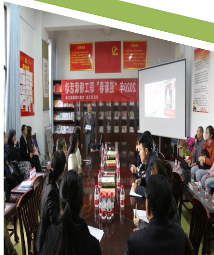
2020年东区大渡口街道总工会 职工“迎新春”领读者活动