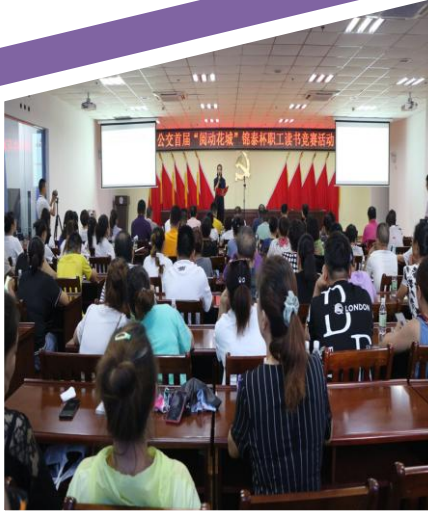
公交首届“阅动花城”锦泰 杯职工读书竞赛活动